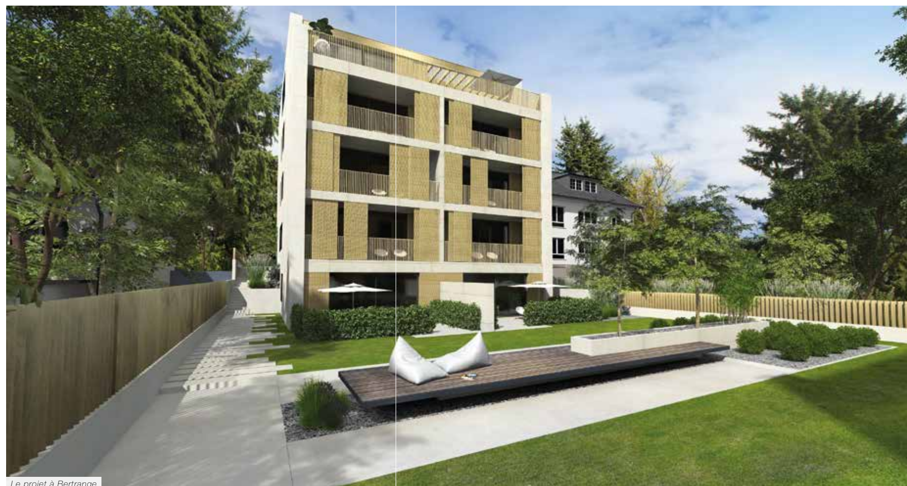
Le projet à Bertrange

Si vous êtes intéressés de travailler avec Saharchitects, n'hésitez pas à consulter leur site Web ou de les contacter pour en savoir plus. ■