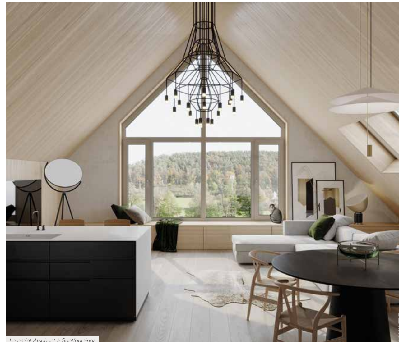
Le projet Atschent à Septfontaines