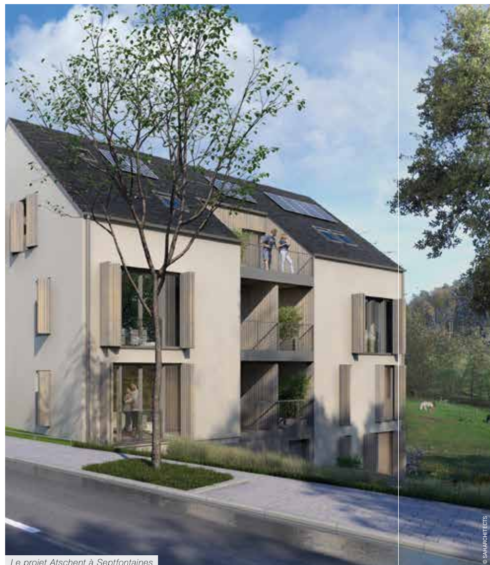
Le projet Atschent à Septfontaines

Ces quatre projets, réalisés avec différents promoteurs immobiliers, sont tous en cours de certification LENOZ. Leurs principes de conception s'alignent évidemment sur les volontés et philosophies de Saharchitects, ce qui se traduit par des bâtiments sophistiqués, qui améliorent non seulement les quartiers dans lesquels ils s'intègrent, mais aussi la vie de ceux qui y vivent.