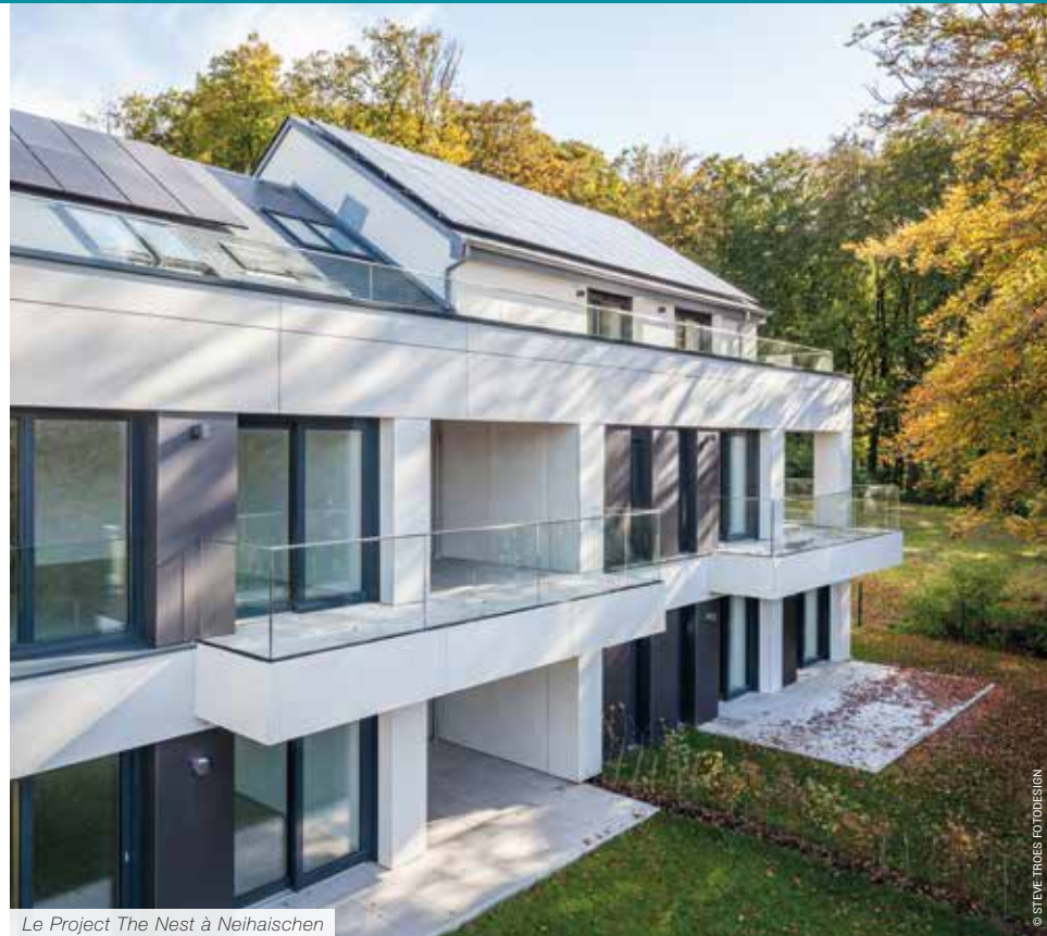
Le Project The Nest à Neihaischen

Le marché du développement résidentiel au Luxembourg est très concurrentiel. La flambée des prix des terrains et de la construction oblige les promoteurs immobiliers à proposer des logements d'une qualité exceptionnelle afin de se démarquer les uns des autres. Pour cela, le choix de l'architecte avec qui travailler sur un projet est primordial.